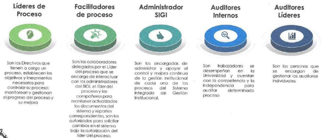
Figura 4 Roles del SIGI

Dentro del Sistema Integrado de Gestión Institucional - SIGI Multicampus se encuentran definidos los roles y las responsabilidades que permiten identificar sus actividades con el fin de asegurar la eficacia y el logro de los resultados previstos.