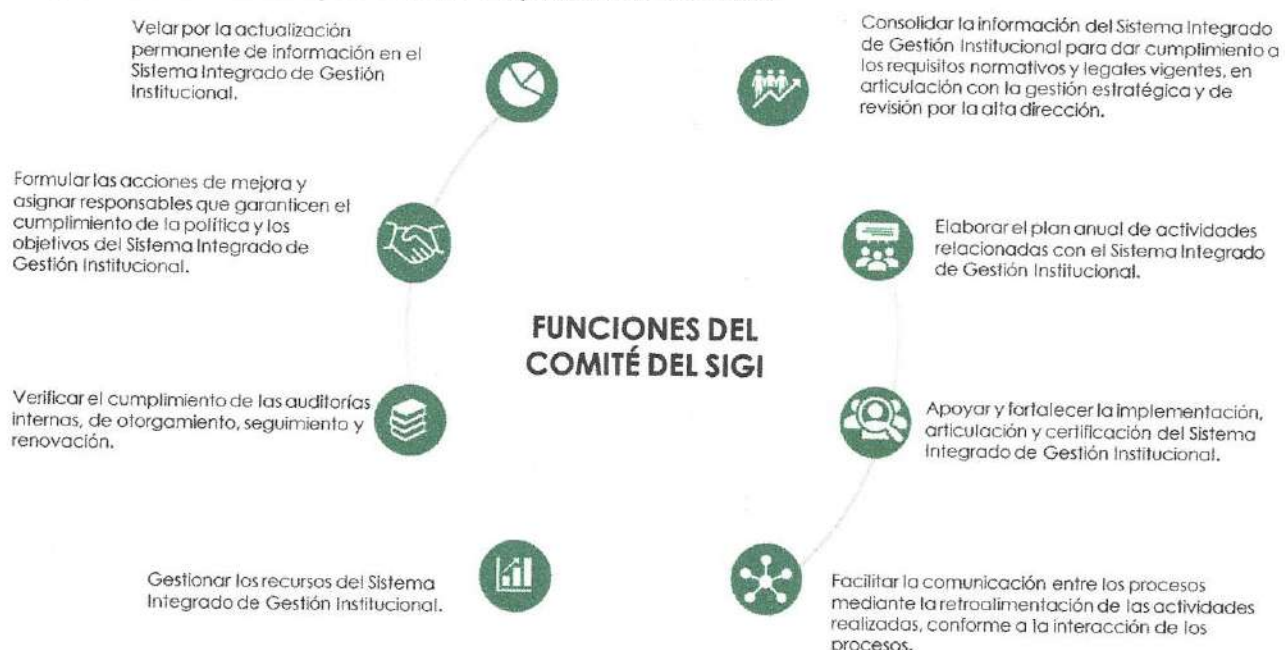
Figura 5 Funciones del Comité operativo del SIGI

El objetivo del Comité está centrado gestionar y apoyar la toma de decisiones relacionadas con el Sistema Integrado de Gestión Institucional, teniendo en cuenta los resultados de la medición, planes de mejoramiento y riesgos; así mismo, sus funciones están determinados así: