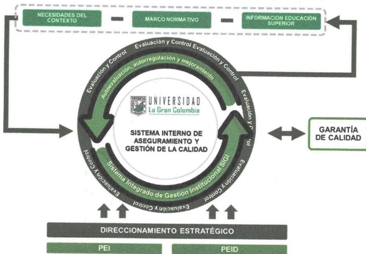
Figura 1 Sistema Interno de Aseguramiento y Gestión de la Calidad

La Política establece la articulación entre los dos sistemas; el Sistema de Aseguramiento de la Calidad y el Sistema Integrado de Gestión Institucional - SIGI Multicampus, desde lo administrativo y académico.